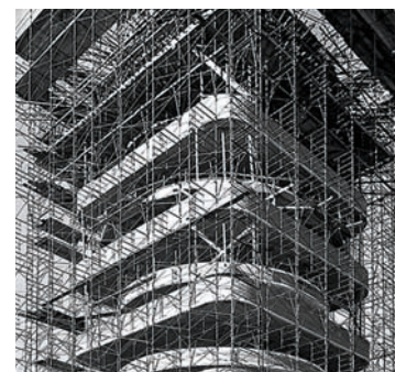
Construction of Wright's Johnson Wax Tower

gía y de la historia del arte y de las ideas donde puede encontrarse una explicación a las obras más radicalmente ilógicas, como el Crown Hall o la Casa Farnsworth, la Villa Savoye o el Narkomfin. Pero para llegar a entender lo que estos edificios nos proponen es necesario estudiarlos a fondo, conocer lo que fueron de verdad; conocer la evolución de su proyecto inicial, las condiciones de su materialización, la influencia del cliente en el diseño, sus auténticos elementos constructivos, el uso que tenían sus espacios y la suerte que corrió el edificio desde el momento en que empezó a utilizarse. La mayoría de estas cosas no han preocupado mucho a los historiadores de la arquitectura del siglo XX, y de todos modos estas informaciones no siempre se hallaban disponibles.