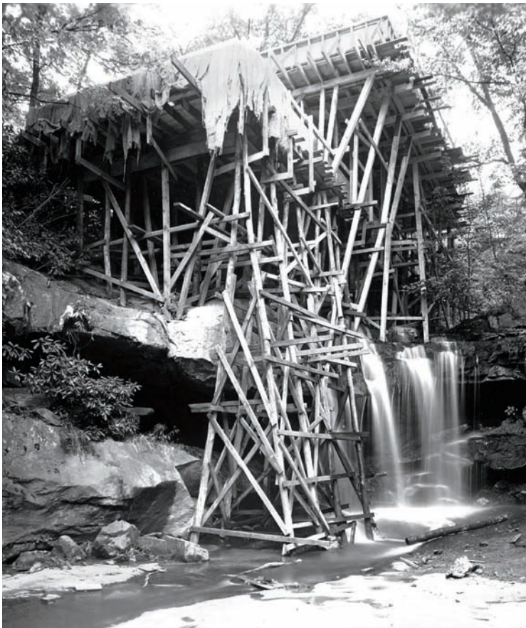
Construction of Wright's Fallingwater

Las «obras maestras del Movimiento Moderno» han cambiado sensiblemente de estatus a lo largo de las últimas décadas. Aunque aparentemente se trate del mismo objeto, la Villa Savoye explicada por Le Corbusier (o por Giedion, o por Curtis, o por Von Moos) se parece muy poco a la Villa Savoye en su avatar de patrimonio arquitectónico. Ya no es un edificio del futuro, sino del pasado; tampoco parecen evidentes sus pretensiones de reforma social; y no lo encontramos funcional ni tampoco ‘científico’ ni ‘exacto’. La manivela para accionar el enorme cristal deslizante de la sala de estar nos hace sonreír al igual que el dormitorio conectado con el baño y el retrete, por no hablar del «radio de giro de las ruedas de un coche» que determina la curva que adopta la planta en el nivel inferior, alrededor del acceso a la vivienda. Lo que sí vemos aquí es un estilo, una ideología sintética que ya no compartimos, pero en la que reconocemos algunas de las quimeras que continúan impulsándonos hoy; cosas, en definitiva, que sólo es posible comprender a través de un estudio detallado, objetivo en lo posible, el mismo tipo de estudio que nos ayuda a entender Pompeya, o la vida en un castillo medieval.