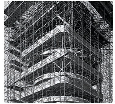
Construction of Wright's Johnson Wax Tower

gía y de la historia del arte y de las ideas donde puede encontrarse una explicación a las obras más radicalmente ilógicas, como el Crown Hall o la Casa Farnsworth, la Villa Savoye o el Narkomfin. Pero para llegar a entender lo que estos edificios nos proponen es necesario estudiarlos a fondo, conocer lo que fueron de verdad; conocer la evolución de su proyecto inicial, las condiciones de su materialización, la influencia del cliente en el diseño, sus auténticos elementos constructivos, el uso que tenían sus espacios y la suerte que corrió el edificio desde el momento en que empezó a utilizarse. La mayoría de estas cosas no han preocupado mucho a los historiadores de la arquitectura del siglo XX, y de todos modos estas informaciones no siempre se hallaban disponibles.