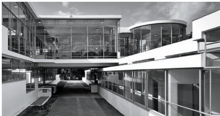
Duiker's Zonnestraal Sanatorium after restoration

The restoration of some buildings we were not very familiar with necessarily had to start from a new tabula rasa . The canons in force in the 20th century have given way to observation from outside, and those in charge of restorations have found themselves forced to ponder on the meaning of each element and try to draw the line, with criteria and discernment, between what is essential and what is accessory. What is more important in the architecture of the Modern Movement?